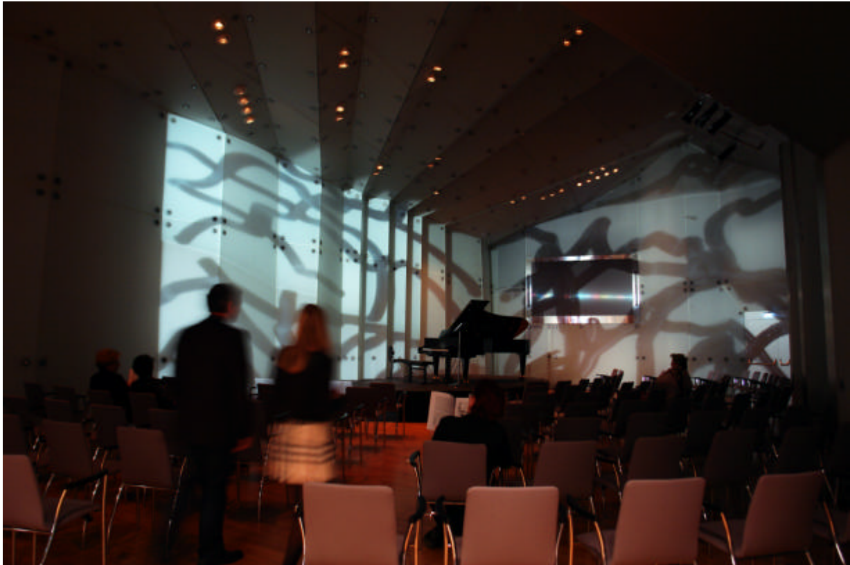
Martin Pohl, Intervention im Kristallsaal

19. September / 22. Oktober Kristallsaal