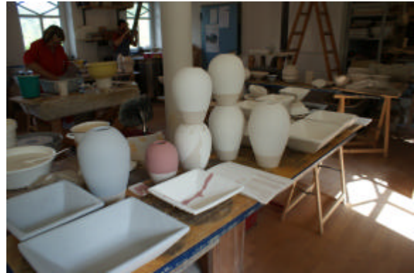
Vorbereitete glasierte Objekte für den Rakubrand

Als Besonderheit gilt das Brennen bei hohen Temperaturen im Steinzeugofen für absolut dichte, lebensmittelechte und säurefeste Objekte wie z.B. Vasen, Ess- und Trinkgeschirr oder auch Wannen für Zimmerbrunnen.